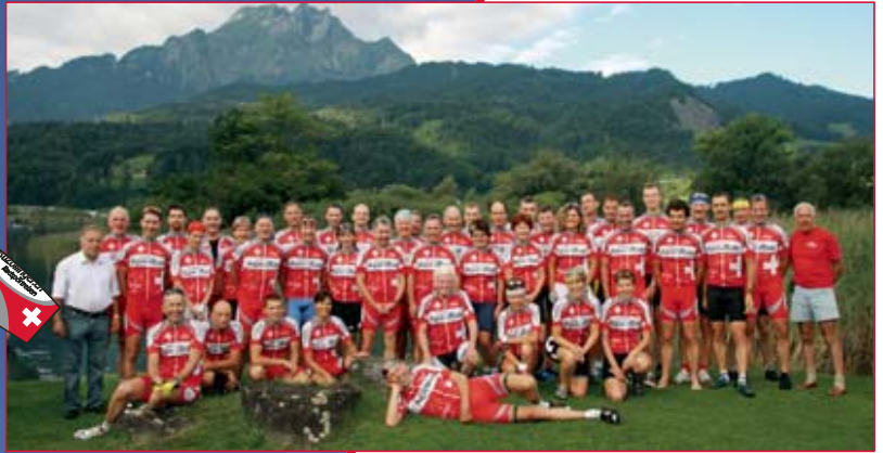
Die durchtrainierten Teilnehmer des SwissAlpenRide 2008.